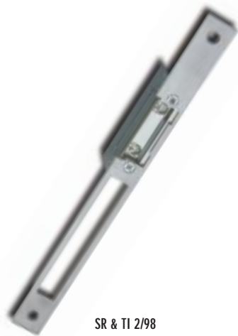
SR & TI 2/98

Les premières gâches qui intègrent une protection électronique